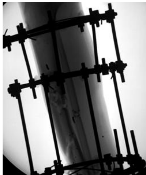
Рис. 7. Рентгенограммы костей левой голени после остеотомии и проведения дистракции в чрескостном дистракционном аппарате Илизарова, в зоне остеотомии — формирование костного регенерата.

Для анализа эффективности лечения пациента была создана графическая модель (рис. 8), отображающая взаимосвязь между проводимыми медицинскими вмешательствами и динамикой болевого синдрома. Выбор такого подхода обусловлен ключевой ролью болевого фактора в процессе реабилитации, соблюдением пациентом врачебных рекомендаций и необходим для определения дальнейшей тактики лечения.