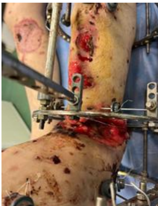
Рис. 1. Внешний вид левой голени при поступлении.

лые раны диаметром 4–5 см, заполненные грануляционной тканью в пределах подкожной клетчатки (рис. 1). Пульсация на тыле стопы не определялась, пальцы теплые, находились в положении сгибания, активные и пассивные движения ими ограничены, чувствительность значительно снижена по тыльной и подошвенной поверхности. Имелось анатомическое укорочение левой голени на 5 см (сформированное на этапах эвакуации). Движения в левом коленном суставе в полном объеме.