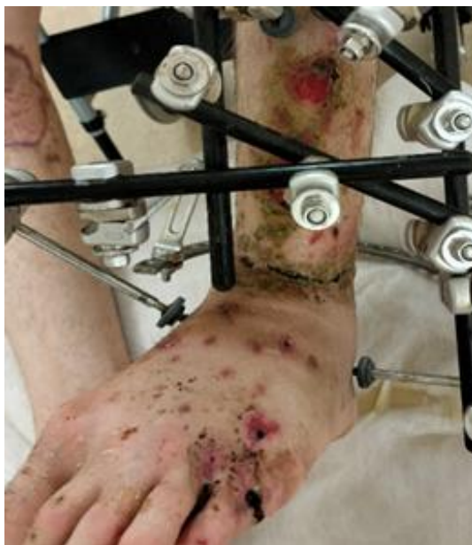
Рис. 5. Внешний вид конечности после этапных смен VAC-повязок.

стержневого аппарата, наложение наводящих швов и смена VAC-системы раны левой голени. Кроме того, был выполнен невролиз срединного нерва правого предплечья и демонтаж спицы, установленной по методу Suzuki, с 5-го пальца кисти.