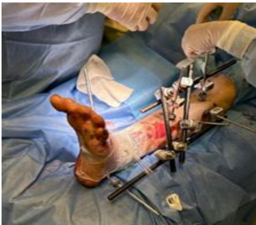
Рис. 4. Внешний вид конечности после демонтажа чрескостного дистракционного аппарата Илизарова, установки аппарата внешней фиксации «Комплект стержневой военно-полевой» и VAC-повязки.

кальций-альгинатной повязкой Sorbalgon Ag . Через 7 суток с целью активного удаления раневого отделяемого, стимуляции ангиогенеза, снижения бактериальной обсемененности раны, уменьшения ее размеров и снижения отека тканей установлена лечебная система вакуумирования ран (VAC-система). Для удобства работы с системой осуществлен демонтаж аппарата Илизарова, наложен аппарат внешней фиксации (АВФ) КСВП (рис. 4).