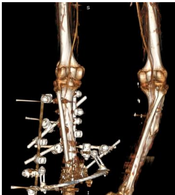
Рис. 3. КТ-ангиография левой нижней конечности.